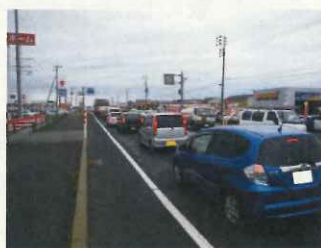
大通西交差点を起点とする渋滞状況（大野大野方向を望む）